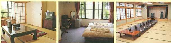
・和室 ・洋室 ・大広間

〈和室〉定員4名様から・7.5畳 〈洋室〉定員4名様・シングルベッド完備 〈大広間〉定員48名様までご利用可能