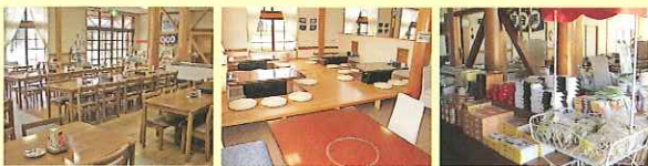
・テーブル席 ・無煙ロースター ・売店

〈テーブル席〉76席 〈無煙ロースター〉36席 〈和室〉30畳 〈売店〉こだわり商品を多数販売